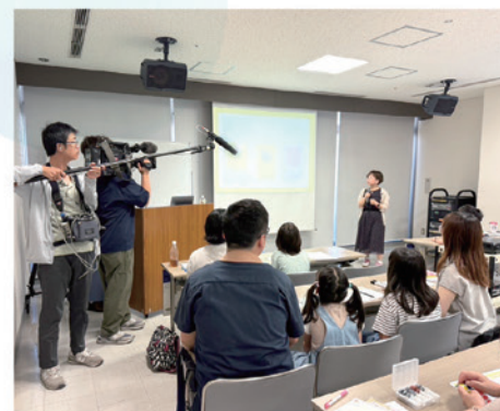
徳島県で開催された「親子おこづかい教室」