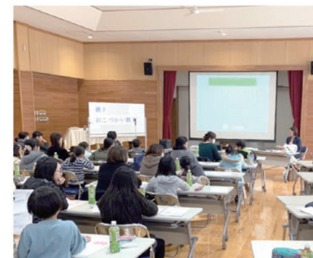
金融機関主催の「親子おこづかい教室」