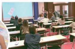
石川県で開催された「大人のためのお金の学校」