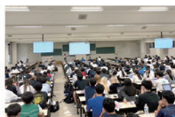
大学での講座の様子