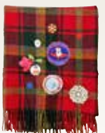
プラチナム・ジュビリーにちなんだ大判ショール。