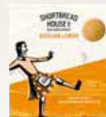
「ショートブレッド・ハウス・オブ・エディンバラ」のお菓子。