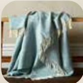
ザ・ウール・ルーム社のダックエッグ色、幅広ブランケット。