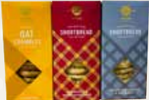
スコットランドの郷土菓子、「リース・オブ・ケイスネス」のショートブレッド。