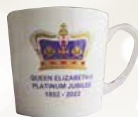
希少となるダーヴィルス社によるプラチナム・ジュビリーのカップ。