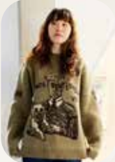
英エドワード8世が編まれたジャカードセーター。

今年も過ぎてみれば、あつという間の1年でした。規制が緩和されて、久しぶりに英国に出かけた方もクリスマスです。今年もよろず屋では英国の素朴で温かな特別なマーケットをお届けします。スコットランドのお菓子、王室御用達のクリスマスティー、砂古玉緒さんのロイヤル・ルビーのクリスマスプディング、寺門さんのシュトーレン、シェイクスピアのチョコレートと、食だけでも書き切れないほどです。そのほか、冬に欠かせないウール・ブランケット、ブルーフェイスドレストスターの羊毛で編んだソックス、「オールドマンズテラー」の服など勢揃いです。ご家族へ、そしてご自身のためのギフトが見つかりますよう。今年最後の営業、ぶらりと気分転換にいらしてください。