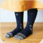
ヴォイクッカ(セイヨウタンポポ)デザインの北欧タイツ。