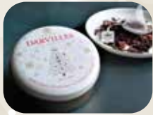
ダーヴィルス社の「クリスマス・インフュージョン・ティー」

2022年12月5日(月) ~ 12月11日(日) 11:00 ~ 18:00(最終日も18:00まで)