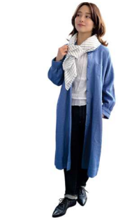
リネン、シルク素材の新作、ロンドン・ハムステッドで生まれた春のコートドレス。