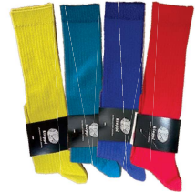
スカート、パンツが引き立つフィンランドの色、リブハイソックス(特別価格)